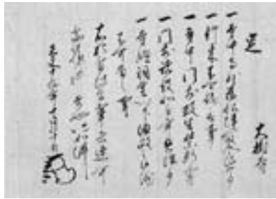
▲今川義元禁制 天文19(1550)年 大樹寺蔵