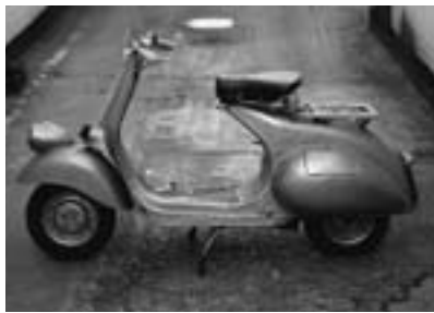
▲スクーター《ベスパ125cc》 1951年ピアッジョ社