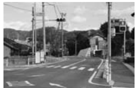
▲上六栗住民広場前の信号

【回答】 約800mほどの区間になりますが、県に要望し早期の拡幅をお願いしています。