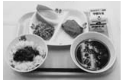
▲出場したメニュー

【主食】さっぱりなすじゃこごはん 【主菜】なすのベーコン巻フライ (幸田町特産のなすを使った料理2品は、小中学校の家庭に募集した「ふるさとの自慢料理」の中から選んだ献立です。) 【副菜】野菜の昆布あえ 【汁】根菜汁 【デザート】梨