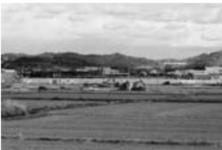
▲西側から見る新駅

【回答】 図書館などは、ほかの自治体の社会教育施設とも連携しておりますので、火曜日定休への変更は困難です。