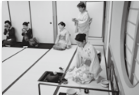
▲和室ではお茶も振る舞われました