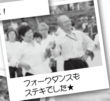
フオークダンスも ステキでした★