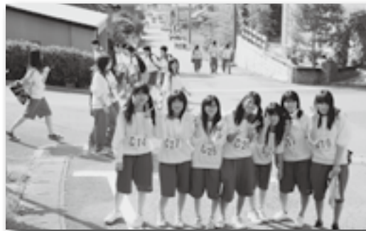
▲本光寺（中間点）付近。まだまだ元気！