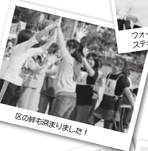
区の絆も深まりました!