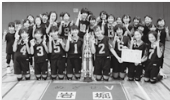
▲6月の大会に続き優勝した岩堀子ども会A

優勝 岩堀子ども会 A 準優勝 市場ジャイアント子ども会 3位 大草子ども会、高力神山子ども会