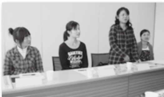
▲気付かなかった貴重な意見がたくさん

平成 23 年度第 1 回外国籍町民会議が中央公民館で開催されました。4人の外国籍住民が参加し、生活して困ったこと・良かったことの見聞交換を行いました。「公共施設にローマ字の表示をして欲しい」、「図書館に外国語の雑誌や小説を置いて欲しい」などいろいろな意見が出されました。