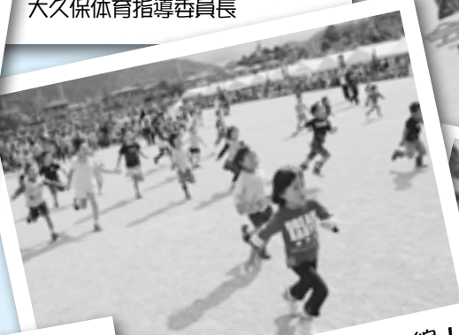
パパ・ママのもとへ一直線！ (ここまでおいで)