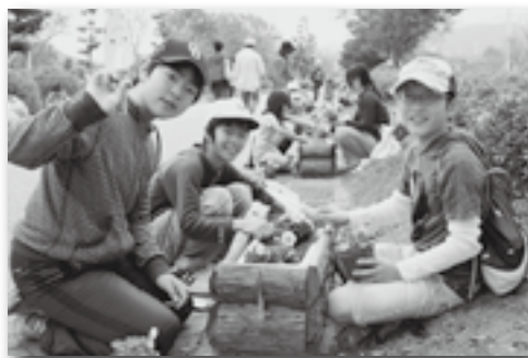
▲コンテナにも植栽しました！

(株)デンソーと幸田町の共催で、中央小学校と荻谷小学校の児童や地域住民および社員など約230人が参加しました。クリーンウォークという清掃活動が行われ、幸田中央公園では、町の花である椿の記念植樹や、花壇の植栽などが行われました。また、商工会青年部の協力のもと、町の名産「筆柿」を使ったスープカレーのレシピ紹介がされ、昼食として振る舞われました。