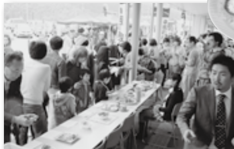
▲おいしそうな香りに人だかりができました