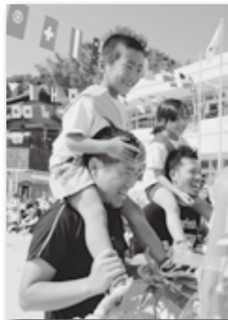
▶がんばったごほうびの肩車♪（深溝）