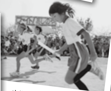
小学生リレーも大迫力！