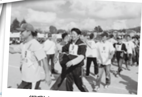
綱引きの場所交代は ハイタッチをしながら♪