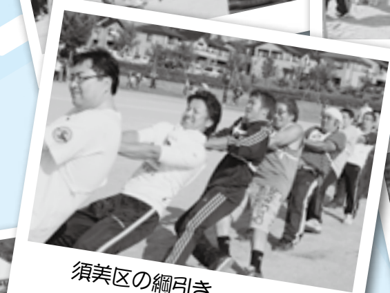
須美区の綱引き。 強すぎます！