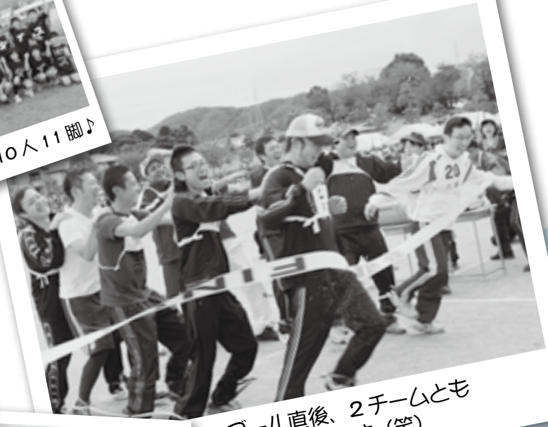
ゴール直後、2チームとも 派手に転びます(笑)