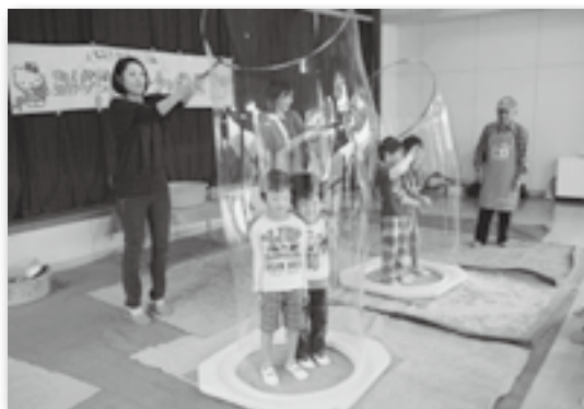
▲シャボン玉の中に入った♪

豊坂保育園の父母の会が保育園にシャボン玉おじさんを招待しました。シャボン玉おじさんは一気にたくさんのシャボン玉を作る方法やシャボン玉の中にシャボン玉を入れる方法などを教えてくれました。そのあと、園児たちは園庭で思い思いにシャボン玉を作って遊びました。