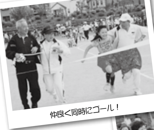
仲良く同時にゴール!

10月23日(日)に第56回町民大運動会が行われ、町民約8,000人が参加 向けて大きな声援が送られていました。まさにスポーツ日和となったこの 区対抗の結果は次のとおりです。【優勝】逆川区、【準優勝】横落区、