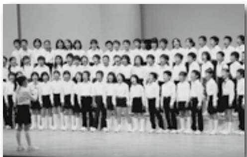
▲荻谷小学校の合唱

第6回幸田町小中学校音楽会が町民会館さくらホールで行われ、町内6小学校の児童と3中学校の生徒 560人が参加しました。「出会い・ときめき・響き合い」をテーマに、今まで練習してきた成果を出そうと、一生懸命に歌ったり、演奏したりしました。