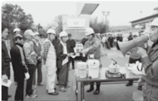
▲起震車体験や非常食の試食（深溝）