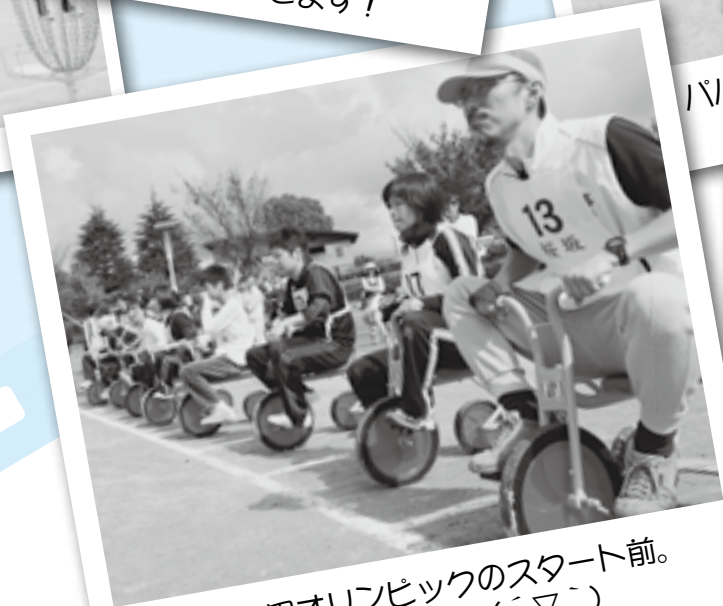
幸田オリンピックのスタート前。 いりしすぎる(´▽`)