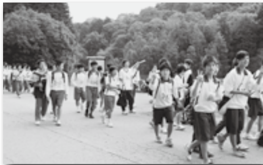
▲深溝断層を見学してから、再出発！

幸田高校の全校生徒が参加のもと、幸田町史跡ウォーキングが行われました。幸田高校創立40周年の記念イベントで、幸田高校から深溝断層、本光寺、幸田文化広場などを經由する約20kmのコースを歩き、町内の自然や歴史に触れました。生徒たちは疲れても励まし合いながら最後まで歩ききり、友人・クラス・学年の結束を深めていました。