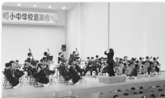
▲南部中学校の弦楽合奏