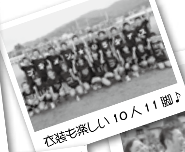
衣装も楽しい10人11脚♪