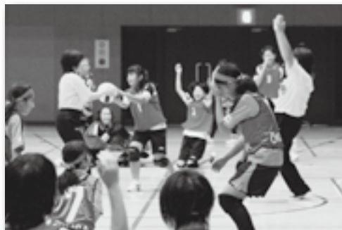
▲どの試合も接戦でした！