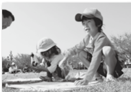
▲思いのままに楽しく描きました♪