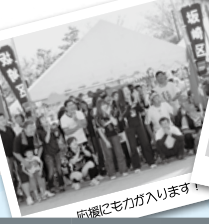
応援にも力が入ります!