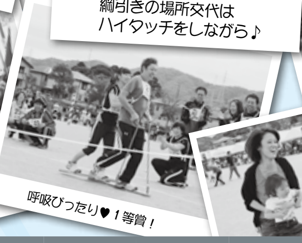
呼吸びつたり♥1等賞!