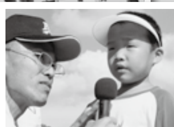
ほおの汗がジャンケンNo.1の 壮絶な戦いを物語っています♪