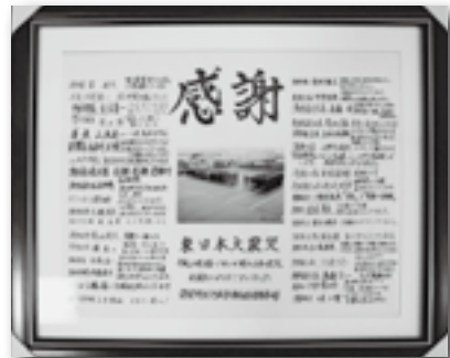
▲被災地の隊員からの寄せ書き