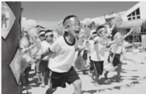
▲元気いっぱいの入場です（坂崎）

10月1日に坂崎・大草・わした・菱池・幸田・豊坂、8日に里・深溝保育園で運動会が開催されました。園児たちはこの日のために練習した踊りを披露したり、保護者と一緒に走ったり、元気いっぱいの姿で会場を魅了しました。会場は歓声と笑い声にあふれ、とてもにぎやかな親子のふれあいの時間となりました。