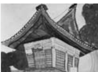
「夕暮れの熊野神社」 【水彩画】