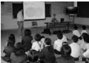
▲養豚や豚肉について学ぶ

子どもたちは、養豚の実際の様子やその仕事の大変さを知ると同時に、今までなんとなく食べていた豚肉をはじめ、多くの人の手による食べ物に対するありがたみを知るようになりました。