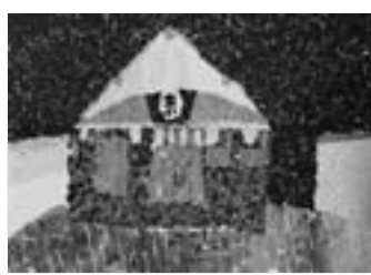
「新しい体育館」 【貼り絵】