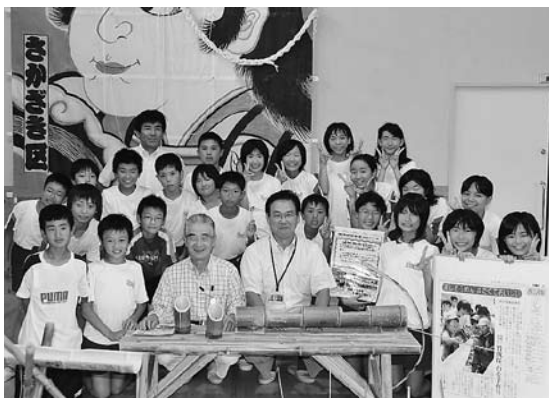
▲竹ペンチの贈呈式

また、6年生は、町立図書館への竹ペンチ贈呈式に、竹の学習のきっかけを作ってくださった講師を学校にお招きして、学習の報告とお礼をしました。