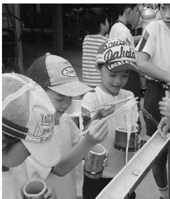
▲流しそうめんの会

流しそうめんの会は、午前中に坂崎保育園で、午後は全校児童を招待して行いました。全校分のそうめんをゆで、自分たちが育てたキュウリも切って、一緒に流しました。6年生が流してくれるそうめんを、下級生はおいしそうに食べていました。そうめんは、あっという間になくなってしまいました。