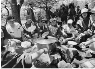
▲カレーライス作り

①の中学生としての自覚を持つための一つの取り組みとして、学習についてのオリエンテーションを行いました。中学校での学習の基本的なルールや家庭学習のやり方などの説明を受けました。日々の積み重ね