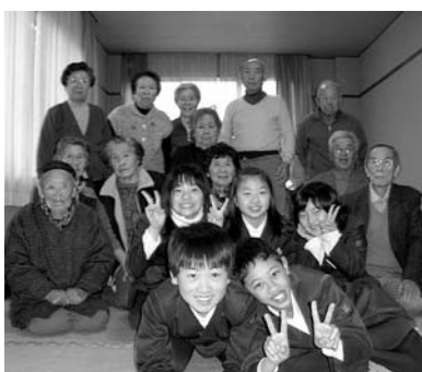
▲ハイ、チーズ！おじいちゃん おばあちゃんと記念撮影

といった内容の心温まるお手紙を いただきうれしい気持ちでいつぱ いになりました。