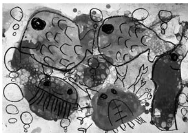
なかよし海のなかまたち 【水彩画+クレヨン】

先生から すくすく とのびたくすの木を 葉っぱの一枚一枚ま で良く見て描く事が できました。影の部 分も工夫して色を塗 ることができました。