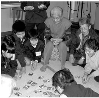
▲カルタとり！皆さんたくさん とってくださいね

5年生は、福祉の学習として、毎年、学区にある幸田町老人福祉センターを訪問させていただき、お年寄りの皆さんと交流をする時間をとっています。 交流会では、「お年寄りの皆さんが笑顔になれるような交流会にしよう」を目標に、手作りすごろくや福笑い、ボーリングや輪投げなどを準備しました。