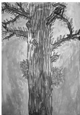
幸田小のくすの木 【水彩画】

今回一緒に交流をしていただけ た岩堀・海谷・里・大草地区のお じいちゃん、おばあちゃん本当に ありがとうございました。