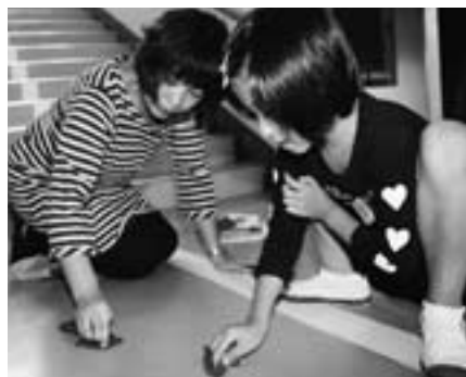
▲お母さんと床みがき

ぼくは、おやふれ合いさきょうのとき、外そうじのたんとうでした。ときどきすずしい風がふいたけど、外はあつかったです。先生が「池のまわりの草をどんどんむしって」と言いました。お父さんが「草を多くとった方がかちだよ」と言ったので、すごいしんけんががんばりました。とちゅうで「がんばってるね」と、おとうさんがほめてくれたので「がんばってるよ」とますますがんばりました。かたづけをしおわったら、ぼくもお父さんもあせだくだくでした。二人で、たけみに山もり2はいとれました。さいごには、かちまけをわすれてしまいました。ぼくは学校がきれいになってうれしいなと思いました。(2年男子)