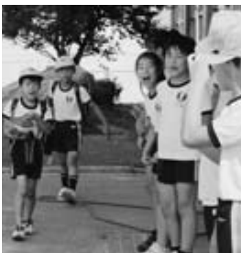
▲玄関先で朝のあいさつ

中央小学校では、4月から「えがおであいさつ20回」を合い言葉にあいさつの輪が広がってきています。朝、4年生以上の代表児童が、積極的に玄関に立ち、あいさつ運動を盛り上げています。2学