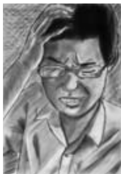
「しまったー！」 【コンテ画】