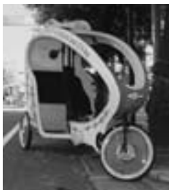
▲わたしが乗った ペロタクシー

▼こんな暑い夏がいつまで続くのかと心配していましたが朝はめっきり涼しくなってきたので、秋の夜長を楽しめたらいいのかなあと思っている今日このごろです。 さて、皆さん！もう行きましたか？どこへ行って。決まってるでしょ（何が…）あいちトリエンナーレ2010ですよ。トリエンナーレって？？？都市とアートが響き合う、3年に一度の国際芸術祭ですよ。現代美術と舞台公演、世界の最先端がここ愛知に集結しちゃうのよ。10月31日までです。で、お見逃しなく。 芸術とかけ離れたところにいるわたしが行った感想は…。なんかわからんけど、なにかを感じたような気が…。（ほんとに？怪しい）まあ、一度行ってみて。自転車好きのわたしは、会場を無料で走っているペロタクシー（自転車タクシー）に乗ったんですが、実はそれが一番感動したのよ。（笑）。運転したかったよ。（R）