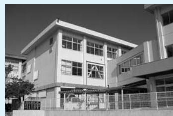
▲深溝小学校校舎地震補強工事