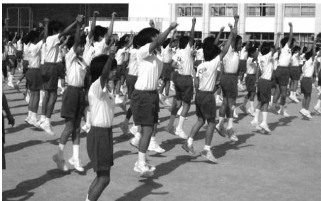
▲島唄ダンスの練習風景

だんだんと美しいハーモニーが校舎内に響くようになっていく様子から、生徒たちの成長を耳からも感じ取ることができます。