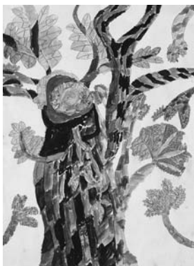
犬のような木 【水彩画】