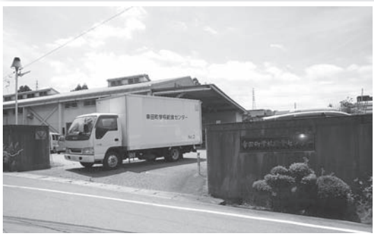
▲7月16日で業務を終了した給食センター