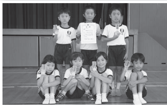
▲小学生1・2年の部優勝 中央ダークレインボー