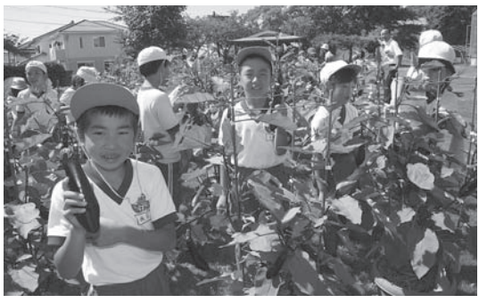
▲豊坂小学校でのナスの収穫

深溝小学校と豊坂小学校で5月に植えたナスが実り、7月15日に児童たちが収穫しました。両校代表の児童が収穫したナスを給食センターまで届けました。このナスを使ったカレーが翌日の給食の献立になり、みんなでおいしくいただきました。芦谷狭間にある給食センターは昭和52年4月から業務を開始し、7月16日をもって32年の歴史にピリオドを打ちます。新しい給食センターは2学期から業務を開始します。