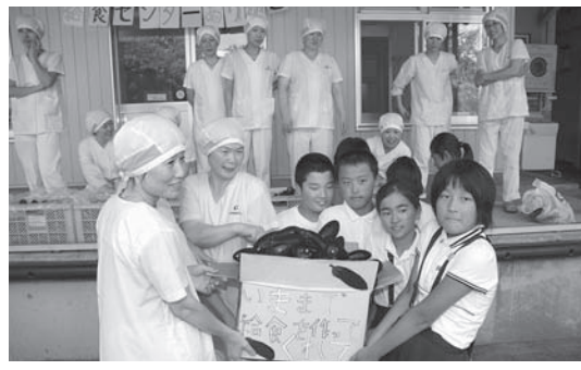
▲感謝を込めてナスを届ける児童（深溝小）