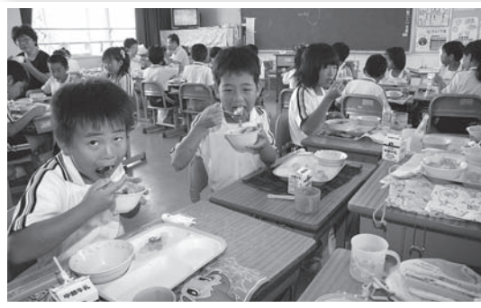
▲ナスカレーを食べる児童（荻谷小）