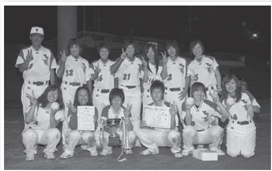
▲優勝した年中夢球