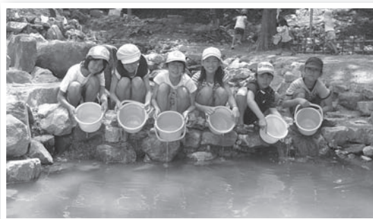
▲めだかを放流する学区の子どもたち