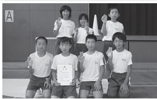
▲小学生5・6年の部優勝 坂小豆しばブラッキー