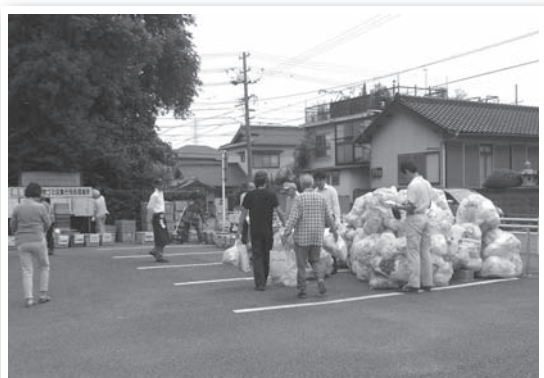
▲横落区ステーション