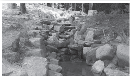
▲ おおぼ 大砦のせせらぎ

「里山水辺ゾーン」が坂崎大砦 おおぼ の京ヶ峯の山すそに完成し記念式典が行われました。これは、地元有志で作る坂崎の自然を守る会が自然の恵が溢れる「きのこの里山」を作ろうと、4年前からボランティア活動を始めこのたび完成したものです。式典終了後、学区の子どもたちが、再生されたせせらぎにめだかを放流しました。