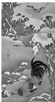
伊藤若冲筆「雪中雄鶏図」