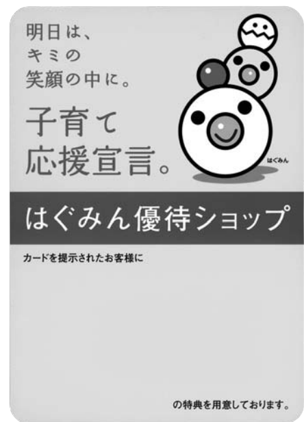
▲協賛店舗に掲示されるステッカー