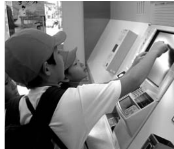
▲切符の買い方を1年生に教える2年生

着いたご褒美をくれたようでした。ごもの国へ着くと、雨がすっかり上がり、子どもたちも開放感から、元気いっぱい遊具で遊んでいました。