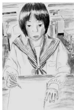
友だちを描こう 【水彩画】

先生から 絵を描いている相手の姿が見事にとらえられています。また、水彩絵の具の特性を巧みに利用し、相手の内面まで描き出そうとする作者の姿勢もこの1枚から感じ取ることができます。