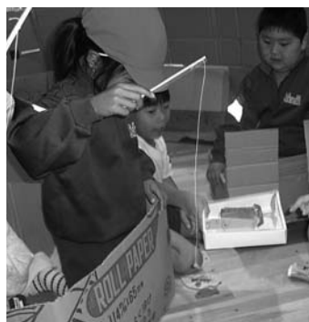
▲船に乗って、魚釣りを楽しむ1年生

おもちゃまつりは、大繁盛でした。夢中になって1年生を喜ばせる姿に成長を感じることができました。