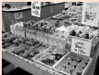
▲筆柿コーナーを設けました

ところ 須美字東山17-5（国道23号岡崎バイパス下り線、幸田桐山-幸田須美インター間）