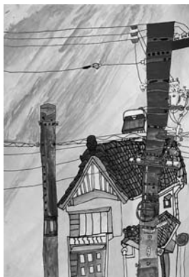
「学校から電柱のみえる風景」 【水彩画】

先生から 近くにある物を丁寧に描くことができました。それにより遠近がはっきりして絵に奥行きができました。