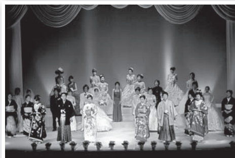
▲ブライダルショー