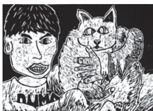
ニャンダフル 【版画】

1年生は、今年1年間の自分たちの歩みを振り返りつつ、学年最後の思い出づくりと進級への自覚を育てるために、リーダー会手づくりの活動で楽しみました。レクリエーションはもちろん、お昼の鍋パーティー、校舎磨き、最後は、今の幸せな気持ちをみんなに分け合うために、花の種をつけた風船飛ばしを行いました。約50個の風船が、北部中のグラウンドから春風に乗って勢よく舞い上がっていききました。(もちろん環境に優しい風船です。)この日の風船は、幸せな気分一杯の北中1年生の気持ちに乗せて、どこまで飛んでいったのでしょうか・・・。