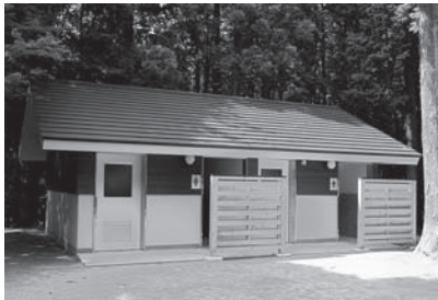
▲新設されたトイレ