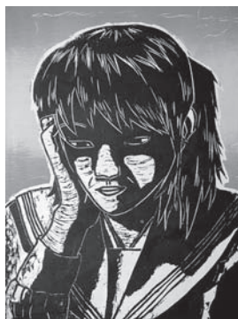
「午後の憂鬱」 【木版画】