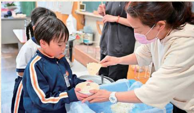
新1年ボランティア活動

本校は、コミュニティ・スクールとして、家庭・地域の人々と連携した教育活動を進めています。約120人が学校支援ボランティアに登録してくださっています。本年度は、「小一プロブレム」に備えて、入学当初からボランティアの人々に1年生の教室に入ってもらいました。「カップを脱いだり、れどうまく畳めないよ」「給食の器のご飯がきれいに取れないな」というようなほんの小さな困り事も、「こんな方法があるよ」と温かく寄り添ってくだ