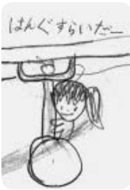
子どものアイデア

子供たちに「学校に、こんな遊具があったらいいな」というアンケートをしたところ、多くのアイデアが。子供たちが、こんな遊具があつたらいいな」というアンケートをしたところ、多くのアイデアが。子供たちが、こんな遊具があつたらいいな」というアンケートをしたところ、多くのアイデアが。