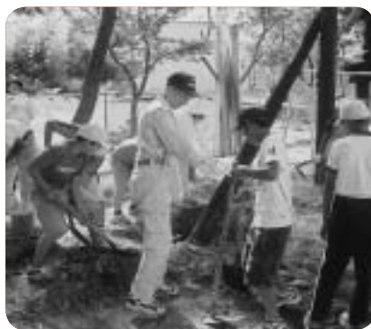
組み立て作業の様子

9月17日(土)午後、50数人のボランティアが集まって、ドッジボールコート、ターザンロープ、ブランコづくりのチームに分かれて作業をしました。地域の土木業者の大きな機械も活躍しましたが、おやじの会のお父さんがたも、はりきって作業に汗を流していました。子供たちも楽しそうにいっしょに手伝っていました。