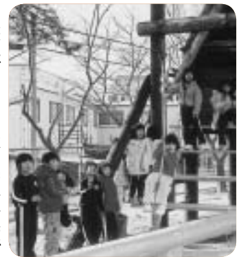
手作りターザンロープ

ターザンロープは、子供たちの人気の遊具です。放課には、楽しそうに滑って遊ぶ姿が見られます。ドッジボールコートは5面作られ、放課の時間になると子供たちが、運動場のあちこちのコートで群れて遊ぶ様子が見られます。集団遊びを通して、社会性を培ってほしいと願っています。