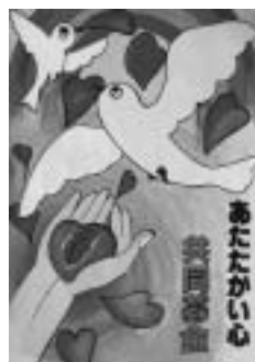
赤い羽根共同募金 【ポスター】

先生から 手に入った力を、点を流れるように打つことで表現できています。形をしっかりとらえて、1点1点を大切にしているところが評価できます。