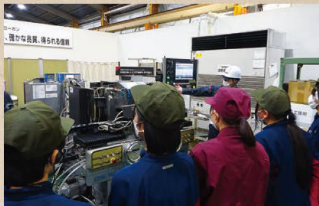
工場見学の様子(株式会社ジェイテクトグライディングシステム)