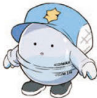
マスコットキャラクター えこたん

明るく、楽しく、前向きな方、大歓迎です。自ら行動し、意欲的であればどんどん成長できる会社です。良い会社をさらに一緒に良くしていきたいでしょう。