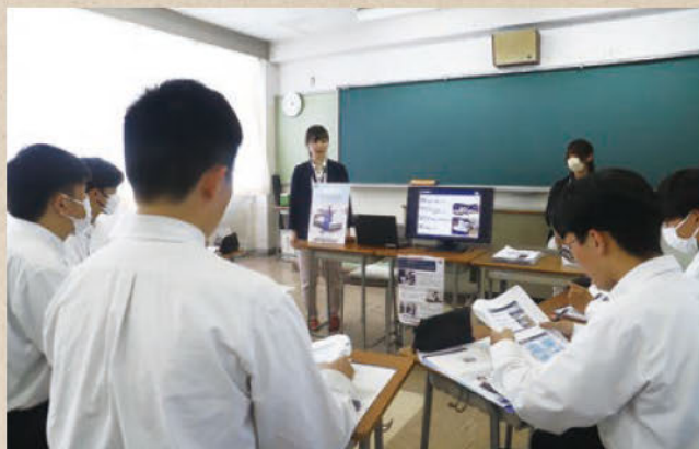
幸田高校での座談会の様子

高校生に地元の企業を知ってもらうため、若手社員との座談会や工場見学を実施しています。