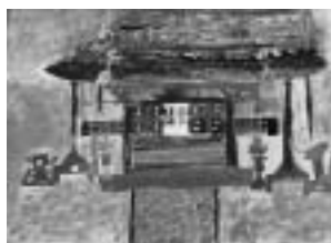
きれいな正げん寺