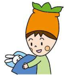
幸田町 すこっぴー