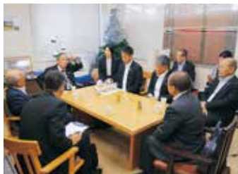
基本構想の説明を受ける