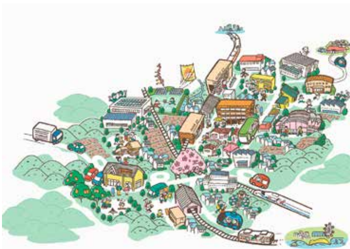
10年後のまちの姿イメージ図