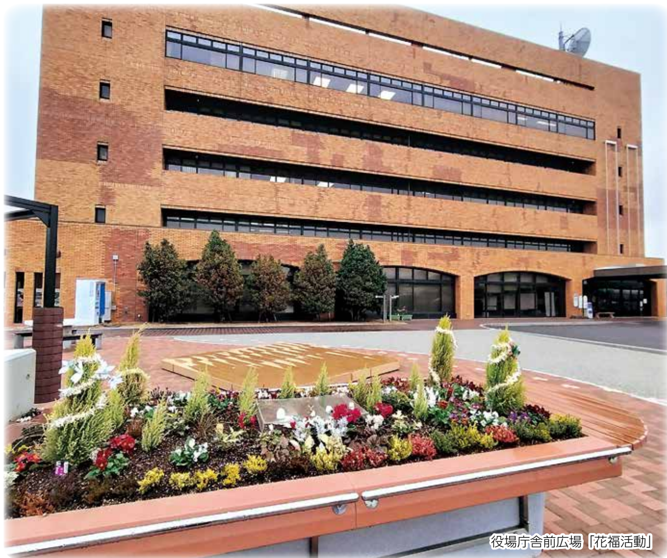
役場庁舎前広場「花福活動」

一般質問は、議員の日常活動と調査・研究、町民の声や自身の考え方をもとに、町長や教育長などの方針を問うものです。