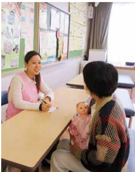
安心して相談できる健康診断の風景

住民こども部長 ▼ こども家庭センターは支援を必要とする方の気持ちに寄り添って前向きに子育てできるよう支援していきたい。