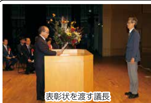
表彰状を渡す議長