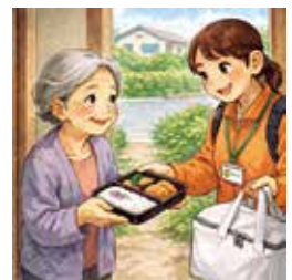
見守り配食のイメージ