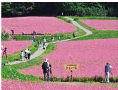
見頃は9月下旬「赤そばの里」(箕輪町)

答 式典等締結に対して経費の予算計上をなぜしなかったか。企画部長▼箕輪町との打ち合わせで、