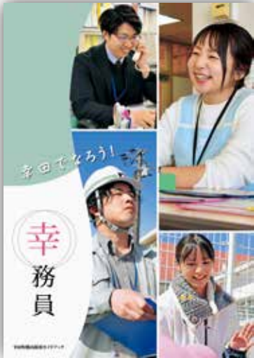
幸田町職員採用ガイドブック