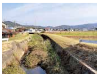
河床が悲惨な柳川

問 河床草刈り再開の考えは。 答 当面は、法面の草刈りへシフト。河床への対応として、予算等の制約があり、河床の浚渫事業で取り組んでいきたい。