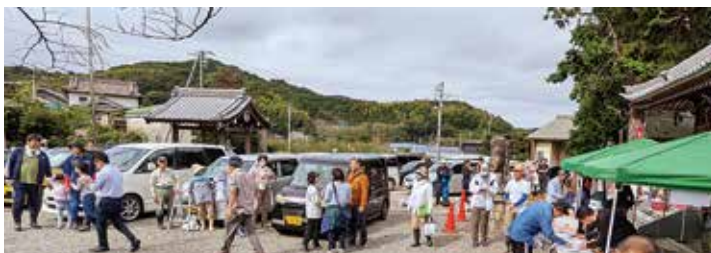
シニア・シルバー世代サポートセンターの高齢者活躍支援

問 街区公園の維持管理と情報発信を。建設部長▼遊具更新に補助制度を活用。台帳デジタル化でICT発信。