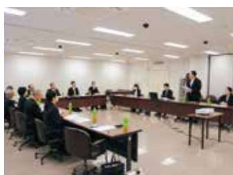
通園制度運用を学ぶ