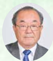
議会議長 廣野房男