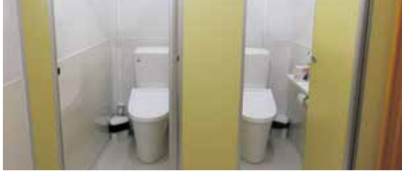
きれいに整備されたトイレ

問 小中学校のエアコン整備がひと段落した今、次は、長年の懸案事項であるトイレ洋式化の整備を進める時期であると考える。 以下を問う。