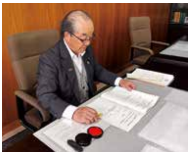
議長室で業務を行う議長