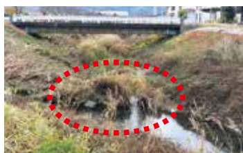
水路の幅がとてつもなく狭くなった 広田川の一部

問 河川愛護活動は、地域の環境を保全し、住民の健康を守るため重要。見通しもよくなり、犯罪の抑制にもつながる。 答 区長や地域の皆さんへしっかりと伝えながら、進めていきたい。