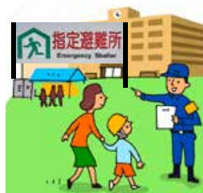
機能別分団員による誘導

・活動内容 ・災害情報の収集と報告、住民への伝達 ・避難誘導と安否確認 ・避難所運営の支援