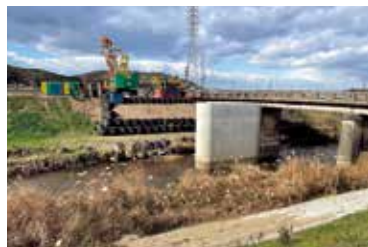
架け替えの進む維新橋

問 必要な橋梁の改修計画と状況は。 答 建設部長▼令和10年度迄に7橋計画。来年度に2橋完了予定。