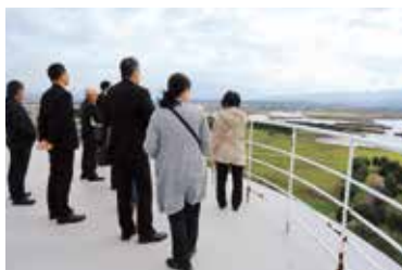
福島潟保護の説明を受ける