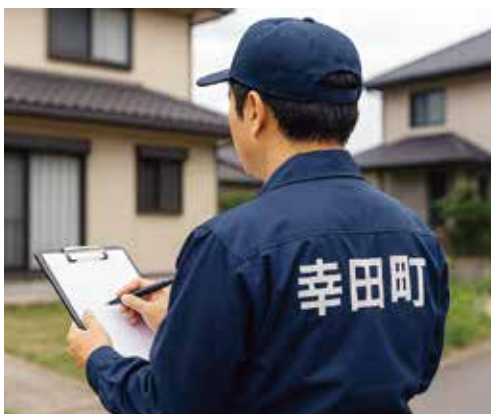
被災調査が紙からタブレットに代わる (イメージ)