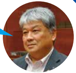
よしもと ちあき 議員 吉本 智明