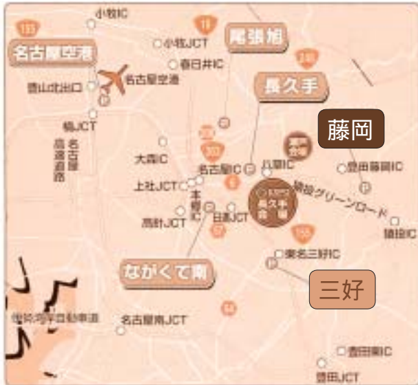
パーク&ライド駐車場の位置