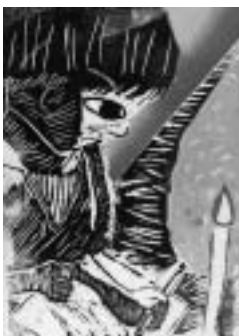
ろうそくの実験 【版画】

先生から 真剣に観察する様子を構図や配色を工夫して表現することができました。ろうそくと周囲の色を変えて明るい様子がよく出せました。