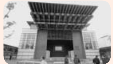
あいち・おまつり広場