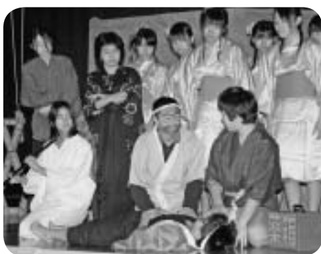
予餞会「金仇敵生命灯火」

後期生徒会としての最大の行事、予餞会を行った。あれもやりたい、これもやりたいという気持ちは一杯なのだが、うまく準備が進まない。先生方から指導をたくさん受