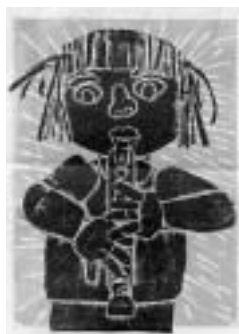
きれいな音でふきたいな 【版画】