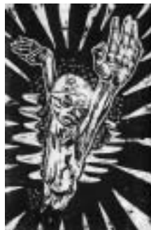
息が続くまで 【版画】

先生から リコーダーを一生懸命吹いている様子を、画面いっぱいに表すことができました。細かい部分も丁寧に作ることができました。