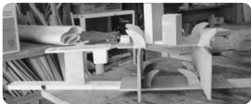
子どもたちが作った廃材を使った作品

「本来、横に使うはずの材木を縦に使ってみたり、左右バランスを無視して作ってみたり、自