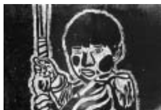
真剣にバットをかまえているぼく 【版画】

先生から 作品がとても丁寧に細部までしっかり創作されています。また、弟とかわい動物を取り合っているほのぼのとした様子がとてもよいと思います。