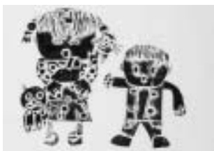
わたしと弟の大切な動物 【版画】

「心錬」という文字を見たとき、どういう意味だろうと思いましたが、先生のお話を聞いて、真剣になれば何でもできること、自分のやったことに責任を持つこと、自分の意思と目的をもって行動すること、反省はするけれど後悔はないこと、が大切だと分かりました。これからの人生は目標を持って、くよくよせず、その場その場を真剣に取り組みたいです。(生徒の感想)