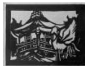
【切り絵】 「金閣寺と鳳凰」