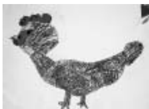
【クレヨン画】 「ポブともだち」

このように、本校の親子活動はPTAの役員だけでなく、学区のかたや地域を巻き込んだ活動になっているのが特色です。