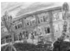
【水彩画】 「創立から26年 たった中央小」

先生から 独特の柔らかなタッチで描かれた作品。あざやかな緑、窓の奥に見えるカーテン、本など細かなところまでよく観察されています。