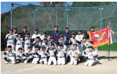
優勝：豊坂学区子ども会

令和6年11月24日㊤、12月1日㊤にとばね運動場でソフトボールジュニア大会が開催されました。5年生以下の新チームとなって初めての大会となりました。優勝は豊坂学区子ども会、準優勝は岩堀・横落子ども会でした。