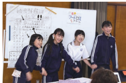
食品ロスに関する歌を歌う児童