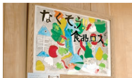
食品ロス削減啓発ポスター

また、令和6年11月1日④の学習発表会では、これまでの学習を歌や劇、動画などを通して地元の人たちに発表しました。今後は、学校内の他学年の児童に対して共有していきます。町としても、この取り組みをできるだけ多くの人たちに知っていただければと考えています。