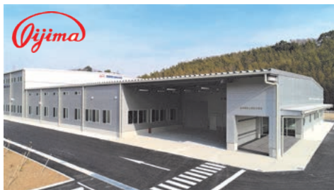
精密金属加工を得意とする飯島精密工業株式会社(幸田工場)

この寄附金は、公立保育園にて保護者との連絡や配布物のデジタル化を行うICTシステムの導入のために活用しました。システムは、令和6年12月に各保育園に導入されていて、保育士の事務が軽減し、子供たちと向き合う時間が増えることによる保育の質の向上が期待されます。