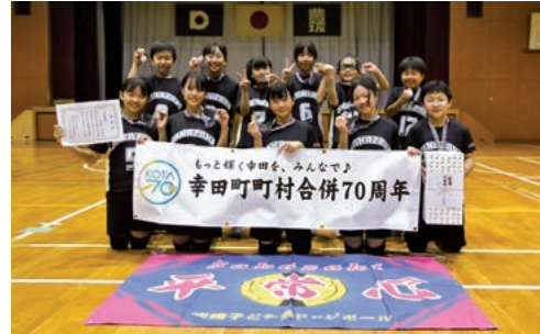
準優勝：坂崎子ども会