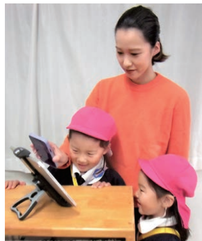
導入されたシステムで登園管理

*自治体の地方創生プロジェクトに対して企業が寄附を行った場合に、税制上の優遇措置が受けられる仕組みです。