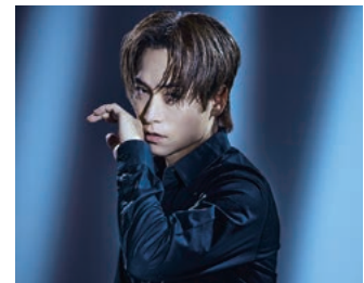
スペシャルゲスト：EXILE TETSUYA

チケッ 電話予約 / Web販売：町民会館webサイト 1月12日㊤ 午前10時～ 窓口販売：町民会館チケットセンター 1月13日㊤㊤ 午前9時～