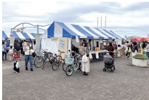
リユース品抽選販売会の様子

循環型社会を形成するには、3R（リデュース（発生抑制）、リユース（再使用）、リサイクル（再生利用））の取り組みが重要です。