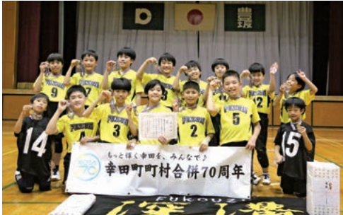
優勝：深溝学区子ども会

令和6年10月20日㊤に豊坂小学校体育館で子ども会ドッジボール大会が開催されました。肌寒さを感じる中でも、白熱した試合が繰り広げられました。優勝は深溝学区子ども会、準優勝は坂崎子ども会でした。