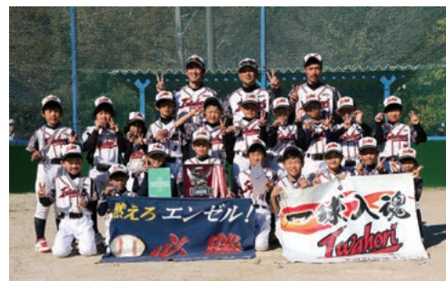
準優勝：岩堀・横落子ども会