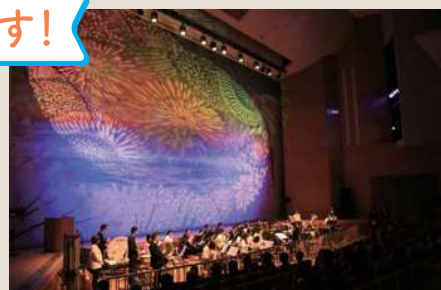
町村合併60周年記念式典時の様子