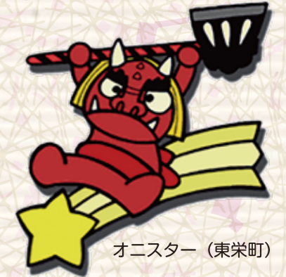
オニスター（東栄町）