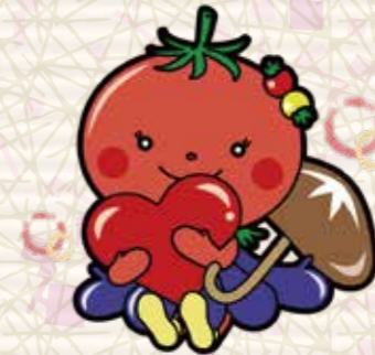
とましーなちゃん（設楽町）