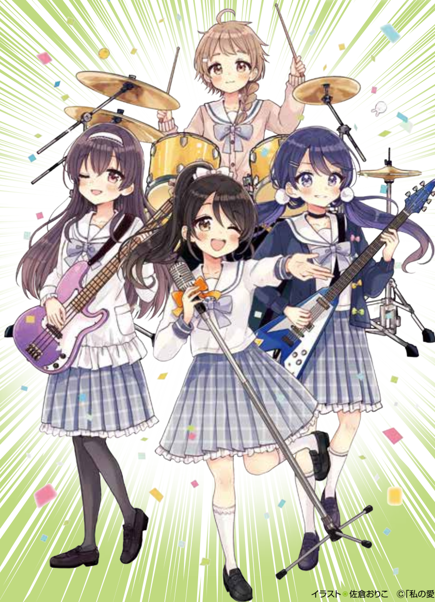
イラスト・佐倉おりこ ©「私の愛した花の名は。」制作委員会