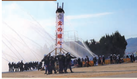
別ショットの写真

加記念品の配布が行われ、各団体の活動をより身近に感じていただくことができました。