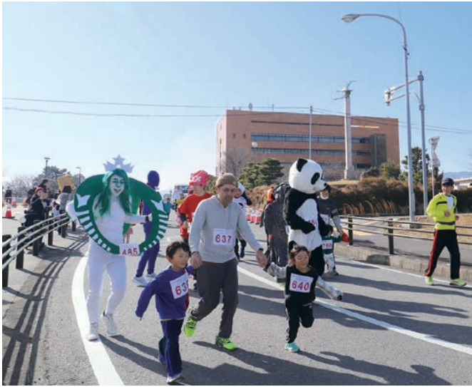
ジョギング大会スタート!