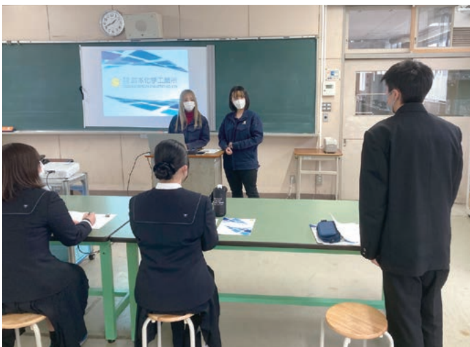
就職についての質問をする幸田高等学校の生徒