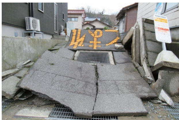
道路被害