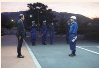
町長に出発の報告をする副町長