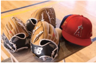
届けられたグローブ