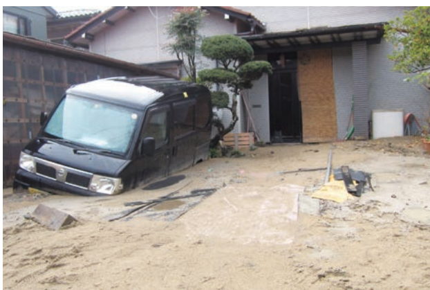
液状化で傾いた家と砂に埋まった車