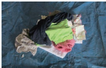
含まれていた古着

燃やすごみの「減量化」「資源化」には町民の皆さんのお力が必要です！ ご協力をよろしくをお願いします！