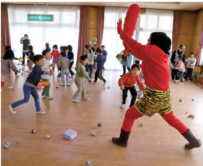
みんなで鬼を追い払え～!

会の後半には年長児のもとに、突然、本物の鬼が登場し、遊戯室は大混乱となりましたが、そこは年長児、みんなで協力しながら手作りの豆をまき、見事に鬼を追い払うことに成功していました。