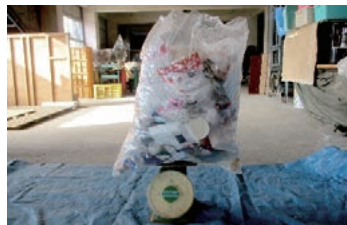
含まれていたプラスチック製容器包装