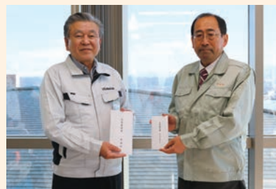
左：内灘町川口町長