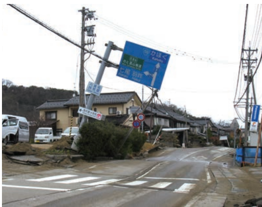
幸田町職員撮影：傾いた道路看板

今回の能登半島地震で最大震度5弱 の揺れが観測されました。能登半島 と比べれば、地震の揺れは大きなも のではなく、役場庁舎のある中心部 には、ほとんど被害がありませんで した。しかし、干拓によって造成さ れた、河北潟干拓地の近くにある宮 坂地区・西荒屋地区・室地区では、 大規模な液状化により、道路や上下 水道、住宅など、多くの被害が発生し、 復旧・復興の目的が立っていません。