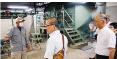
機器の機能を確認する委員

近年、施設設備の老朽化に対応し、将来的なし尿・浄化槽汚泥の処理方法を検討し、調査結果を基に、蒲郡市下水道浄化センターへの直接投入・処理する方法への転換を計画している。