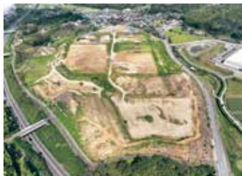
整備中の須美前山工業団地

ことは解説 【※ラーケーション】 愛知県「休み方改 革」小中学校の校外 学習活動のこと。