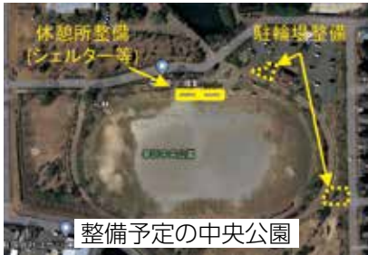
整備予定の中央公園

問 町民の利便性や安全性などに配慮された駐輪場2カ所、休憩所(シエルター)および駐車場に関する、詳細検討・設計を行う。