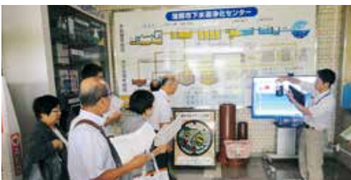
浄化のしくみを聞く委員

農業集落排水から公共下水道への接続が進むなかで、本町の廃棄物処理のしくみや、施設運営などを視察した。