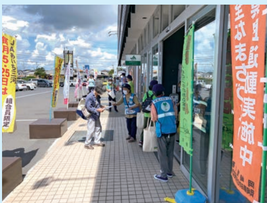
夏の安全なまちづくり県民運動の様子