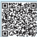
▲町ホームページはこちら

特殊詐欺被害が岡崎警察署管内で多く発生しています。町では、昨年度に引き続き、特殊詐欺対策装置購入費の補助金制度を継続して実施しています(詳細は町ホームページをチェック！)。お近くの家電量販店などで、ぜひ、購入をご検討ください。