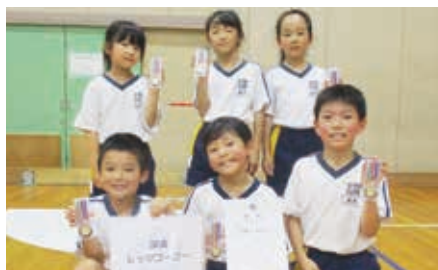
優勝「深溝レッツゴー」