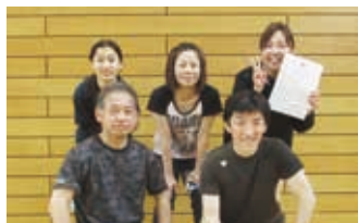
第3位「ちょこミント」