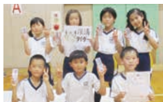
準優勝 「深溝タイガー」