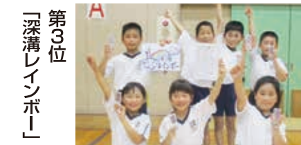
第3位 「深溝レインボー」