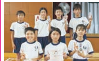
準優勝 「中央ジョーカー」