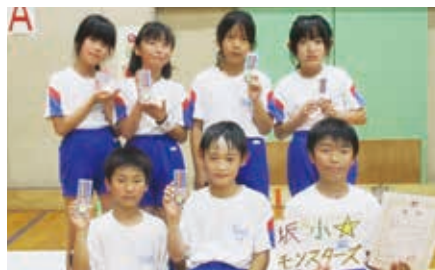
優勝「坂小☆モンスターズ」