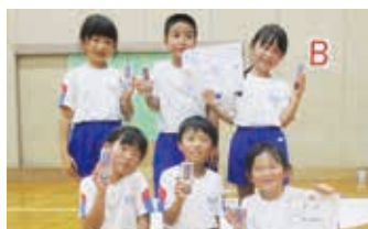
準優勝 「坂小スターズ」