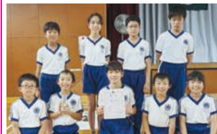
優勝「幸小ルーチェ」