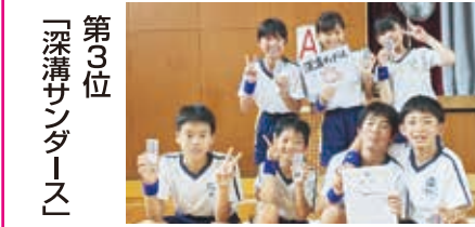
第3位 「深溝サンダース」