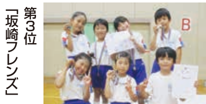
第3位 「坂崎フレンズ」