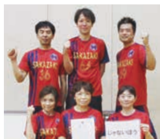
優勝「じゃないほう」