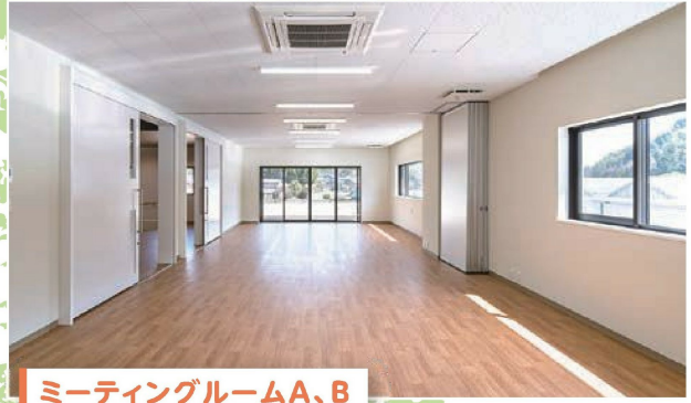
ミーティングルームA、B