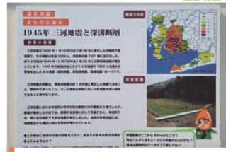
三河地震・深溝断層案内