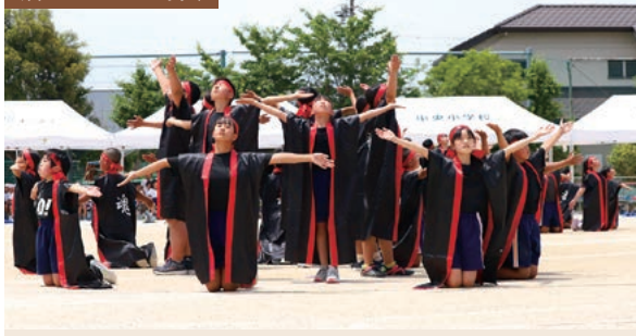
別ショットの写真

競技でも熱い戦いが繰り広げられ、校長先生から120点と言われるほどに、4年ぶりの学区運動会は大成功となりました。