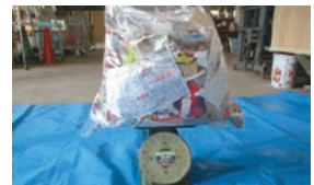
ミックスペーパー 約3.5kg

その後、燃やすごみはどうなったの？ 燃やすごみの減量化をすすめるため、分別の状況をリアルにお伝えするコーナーです。