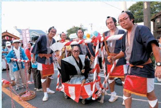
過去の彦左まつりの様子

彦左まつりの主催は商工会ですが、町民が自主的に盛り上げてきた祭りでもありました。祭りに参加する子どもたちがお小遣いのなかで遊びに来て楽しむことができるように、駅前の商店街の人たちは創意工夫しながら露店を出してくれました。各コミュニティや企業は独自の山車を作って祭りに華を添えてくれました。子どもから大人まで彦左衛門などの仮装をして駅前を練り歩く様子は、派手さはなくとも町民が心から楽しめる祭りです。