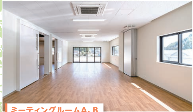
ミーティングルームA、B