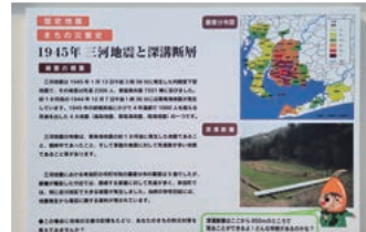
三河地震・深溝断層案内