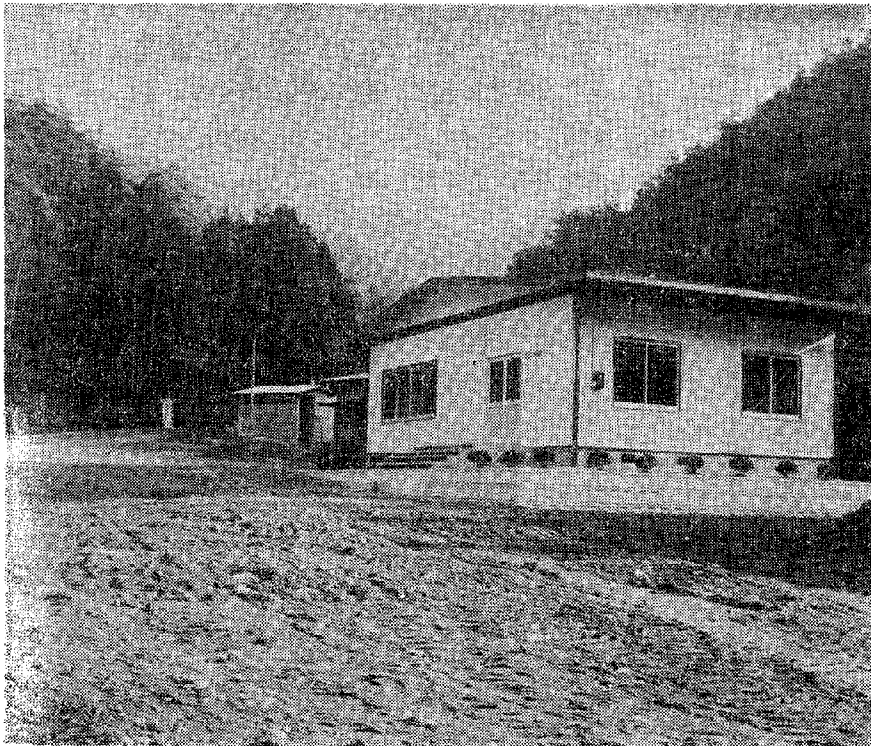
(完成した大井池休憩所)

幸田町大字大草(大井池)地内に昨年九月十日から工事が進められた町立大井池休憩所は、予定どおり十二月十九日完成となり、さる一月十二日竣工式が関係者出席のもとに挙行され、開館されることになりました。 この休憩所は、遠望峰山県自然公園の観光開発を促進するため 大井池周辺観光施設整備事業として無料休憩所を建設し、町民を始め広く県民の健康と情操を高めるとともに憩いの場として建設したものであります。 なお団体による利用については役場産業課商工係まで事前にお申出ください。