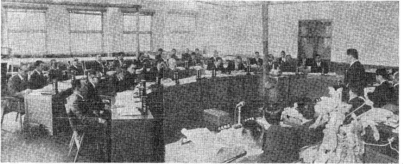
(本 会 議 風 景)