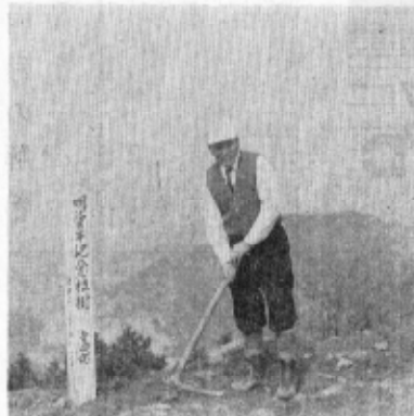
明治百年記念植樹

ことしの四月末から始まるゴルフデンウィークをみます。 二十八日 日曜日 二十九日 天皇誕生日 二十九日 日曜日 三十日 日曜日 三十一日 日曜日 五月一日 日曜日 五月二日 八十八歳 五月三日 憲法記念日 五月四日 土曜日 五月五日 子どもの日 五月五日の子どもの日は、一年一度の「こどもの日」で、全国各地でこどもの活動が盛んに行われます。昭和二十九年四月二十九日天皇の第一皇子と御誕生されました。こどもは、後の一時期は「こどもの日」といって祝われます。