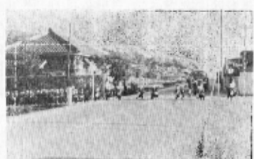
(子どもたちの安全を守るために歩道橋が設置される場所)