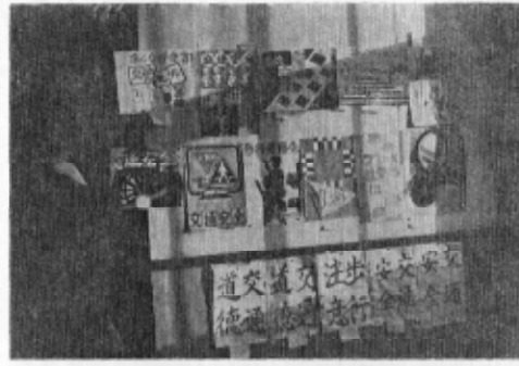
(入選した児童の作品)