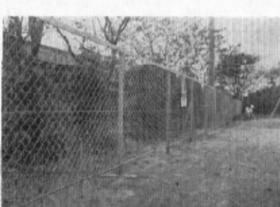
(幸田ライオンズクラブより 寄贈された安全柵)

本校では、前々から運動場周囲... (Text describing the safety fence project at the school, highlighting the community support.)