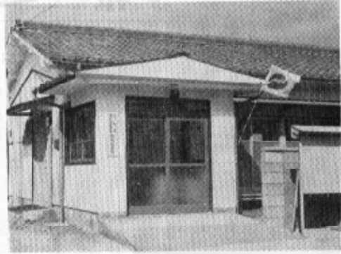
完成した野場駐在所全景